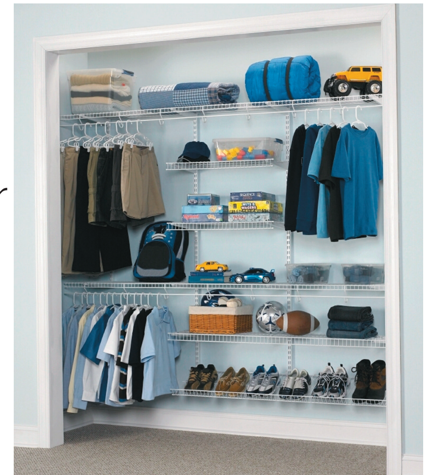
El clóset normal (vertical) consta de una pared de aproximadamente 0.80 metros de profundidad y, aunque estas medidas tornan un reto colocar allí todas nuestras pertenencias, con percheros, organizadores y cajones, se puede obtener un resultado muy interesante.

Finalmente, regala todo lo que no utilices y que esté en buen estado. Ganarás espacio para nuevas cosas y harás una buena acción haciendo felices a los demás. ¡Así todos ganan!