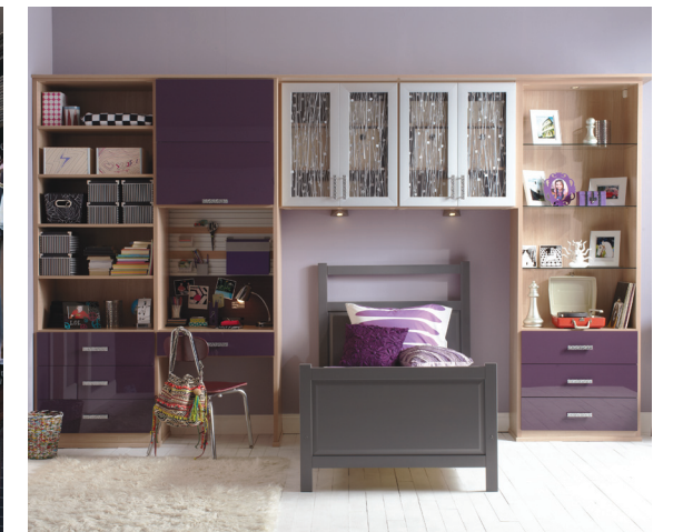
Para aquellos que no les gusta ver el mueble sin pared, con una división en sheetrock obtendrán una terminación profesional que deja el clóset como si fuera parte del espacio desde un principio..

Un clóset de limpieza es imprescindible en el hogar. Es importante colocar en los tramos superiores (a la altura del pecho de un adulto) todas las sustancias tóxicas que se usan para limpiar, así se evitan accidentes..