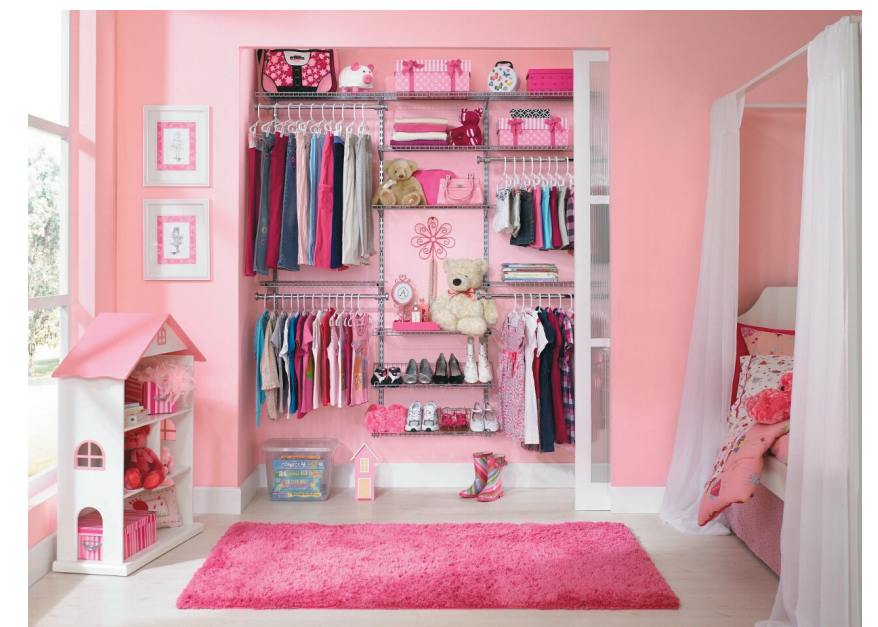
Lo que se puede observar en un armario va desde tubos de metal (plateados, negros y bronce), perchas fuertes (de madera o metálicas), pasando por zapateras y cajas de colores, hasta divisiones según las zonas y espejos de cuerpo entero.