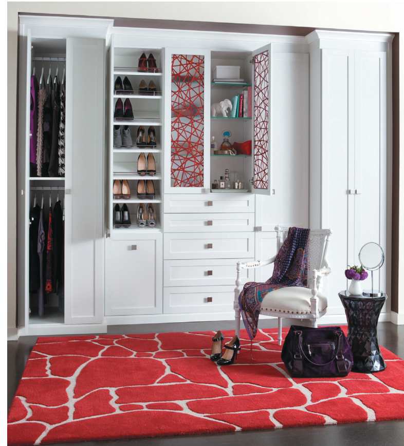
Muchas veces tenemos un área que convertimos en habitación, sala de estar o estudio, pero no cuenta con clóset. Por eso existen armarios de diferentes alturas, texturas y divisiones, para resolver esta situación.