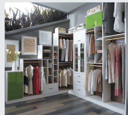
Resulta imperativo aprovechar todas las áreas y alturas. En especial, para colocar artículos que no usamos a diario (como adornos navideños, ropa de invierno, juguetes, almohadas, entre otros). (Foto cortesía: California Closets).