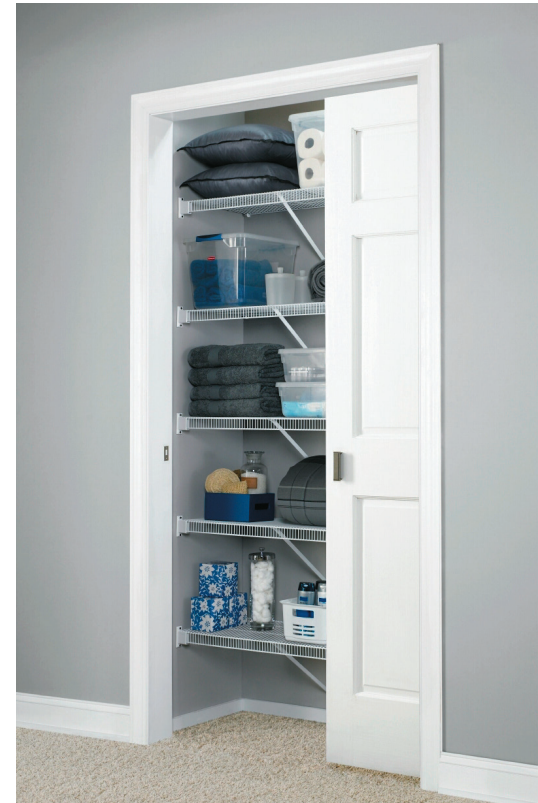
El clóset de ropa blanca es muy práctico, porque además de guardar ropa blanca y de cama (como toallas, sábanas y cubrecamas, entre otros) puede servir para colocar artículos de baño en repisas adicionales y para albergar el calentador.